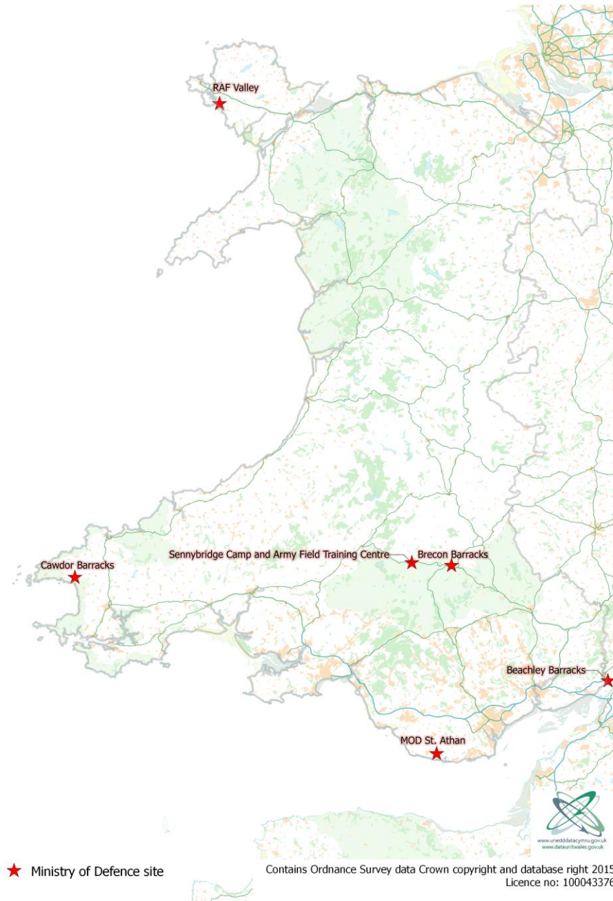
Ffigur 1: Canolfannau'r lluoedd arfog yng Nghymru i ddibenion yr ymchwil hon

Mae Cyfrifiad 2011 yn awgrymu bod tua 0.5% o'r boblogaeth yn blant milwr. Felly, fe fyddai'n ddoeth canolbwyntio ar yr ysgolion sy'n agos i brif ganolfannau'r lluoedd arfog.